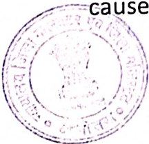
जिला कलक्टर यालोतरा

(2) For the purpose of securing compliance with the provisions of sub-section (1), the Chief Metropolitan Magistrate or the District Magistrate may take or cause to be taken such steps and use, or cause to be used, such force, as may, in his opinion, be necessary.